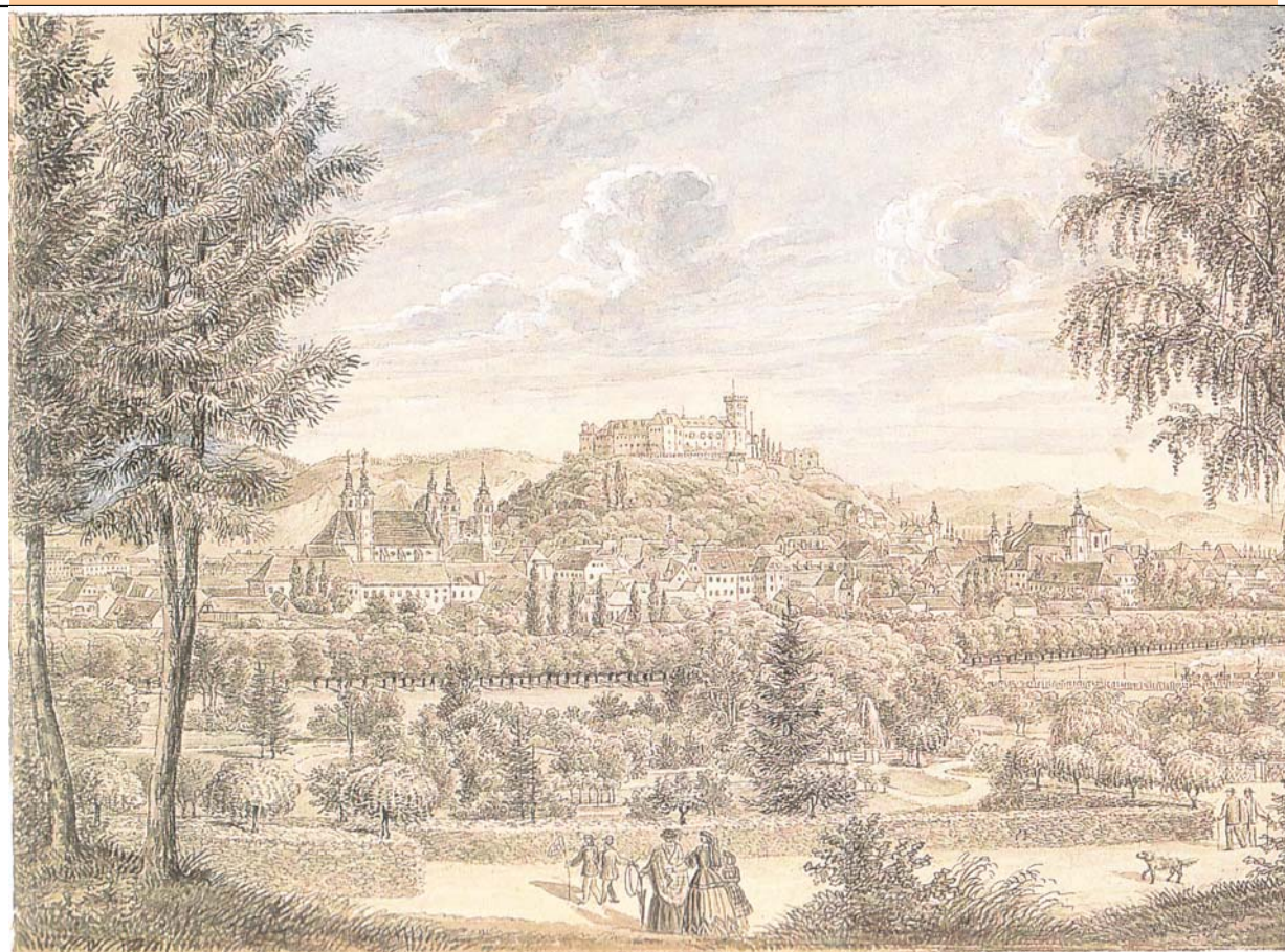
Slika 3: Pogled na Ljubljano v času kongresa

Na velikonočno nedeljo 22. aprila 1821 je bila v ljubljanski stolnici zahvalna maša za uveljavitev miru v Neapeljskem kraljestvu, navzoči so bili vsi monarhi.