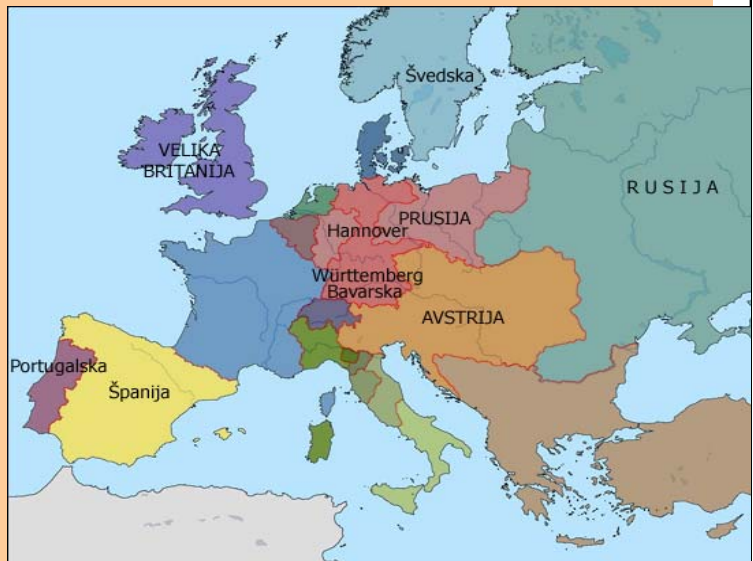
Slika 2: Države udeleženke Dunajskega kongresa napisane z velikimi tiskanimi črkami

Evropski vladarji so tudi želeli preprečiti, da bi se v Evropi znova pojavilo revolucionarno vrenje. Zato so na pobudo kneza Metternicha sklenili sveto alianso ali zvezo. Vladarji (ruski car Aleksander I., avstrijski cesar Franc I. in pruski kralj Friderik Viljem III) so sklenili politično in vojaško zavezništvo. Njihov namen je bil ohraniti obstoječi politični red, vzpostavljen na dunajskem kongresu in preprečiti širjenje naprednih liberalnih idej. Papež Pij VII. ni hotel pristopiti k zvezi, sodelovanje je odklanjala tudi Anglija, turškega sultana pa niso povabili. Članice so se zavezale, da se bodo sestajale takrat, kadar bo v nevarnosti splošni mir; sicer naj bi bili sestanki v določenih razdobjih. Po kongresu na Dunaju so bili še kongresi v Aachnu, Opavi, Ljubljani in Veroni.